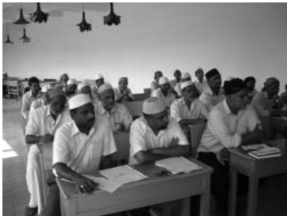
ചെയ്യപ്പെടുകയുണ്ടായി. നമസ്കാരത്തിനും ഭക്ഷണത്തിനും ശേഷം ഒന്നാം ദിവസത്തെ പരിപാടികൾക്കു സമാപനമായി. മെയ് 3 ന് ഞായറാഴ്ച തഹജ്ജുദ് നമസ്കാരത്തോടെ പരിപാടികൾ ആരംഭിച്ചു. തഹജ്ജുദ് നമ

എത്രയത്ര ആലിമീങ്ങൾ എത്ര സമ്പന്നർ ജനങ്ങൾ മുസ്ലിം സമുദായങ്ങളിൽ മുൻനിരത്തിൽ! ഇറങ്ങിയില്ലായവരിൽ മഹ്ദീ മസീഹോ സമാനിൽ വിലാഹത്തിൻ വാഗ്ദാനങ്ങൾ വിഹലമായവരിൽ നിസ്സാരരായവർ ഞങ്ങൾ സൗഭാഗ്യത്തിനർഹർ ഇവർ സുന്ദര ദീനിസ്ലാമിൻ ആധാരമിവരിൽ! പവിത്ര ദീനിസ്ലാമിൻ ചിത്രപദാകകൾ കയ്യിൽ വീശി വീശി വിശ്വാസികൾ ലോകവീഥികളിൽ അഹ്മദിയ്യാ വിലാഹത്തിൻ ഒളിവേറും ധാരകൾ ദിവ്യപ്രഭാകിരണങ്ങൾ പരന്നു പാരിൽ! ശത്രുതൻ ഗുവൃതന്ത്രങ്ങൾ ഫിത്ന ഫസാദുകൾ നിരർത്ഥക നിഷ്ഫല ലക്ഷണഭംഗുരങ്ങൾ ദുർദിനങ്ങൾ കഴുമരങ്ങൾ വേദനശ്ലഹാദത്തുകൾ പിന്നേയും വളർന്നു ഭൂവിൽ അഹ്മദിൻ ശിഷ്യർ! ദർശിച്ചു കൊൾവിൻ അല്ലാഹുവിൻ മുഅ്ജിസത്തുകൾ അല്ലെ ഇതെന്നോർത്തു കൊൾവിൻ കരുണ വർഷങ്ങൾ മുസ്ലിം സമൂഹങ്ങൾ നിങ്ങൾ ഒരേ നേതൃത്വത്തിൻ ഒരു ലോക ജമാഅത്തിൽ അണി ചേർന്നിടുവിൻ! വഴിതെറ്റി ഉഴന്നവർ ഇതരമതാനുചരർ അണയട്ടെ ഹിദായത്തിൻ പതാക കീഴിൽ ലാഇലാഹ ഇല്ലല്ലാഹ് മുഹമ്മദുർറസൂലുല്ലായിൽ ആരവങ്ങൾ ഉയരട്ടെ ഏക സ്വരത്തിൽ.