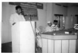
അൻസാനുല്ലാ സമ്മേളനം എറണാകുളം മേഖല