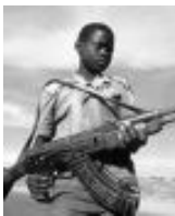
കുട്ടിപ്പട്ടാളം വിട്ടിലേക്ക് മടങ്ങുന്നു