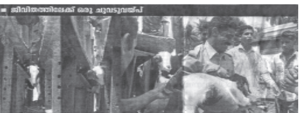
എറണാകുളം പുല്ലേപ്പടി മേൽപ്പാലത്തിനു സമീപം പാളത്തിനടുത്ത് റെയിൽവേ കൂട്ടിയിട്ടിരുന്ന ബീമുകൾക്കിടയിൽ കൂടുങ്ങിയ ആടിയെ അഗ്നിസേന എത്തി രക്ഷപ്പെടുത്തുന്നു.