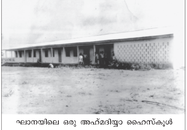
ഘാനയിലെ ഒരു അഹ് മദിയുടെ ഹൈസ്കൂൾ