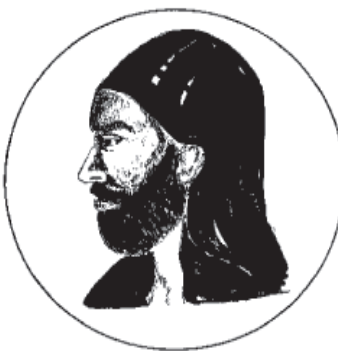
ഇബ്നു സിന (986-1037) മെഡിസിൻ, ഫിലോസഫി, മാത്സ്, ആസ്ട്രോണമി