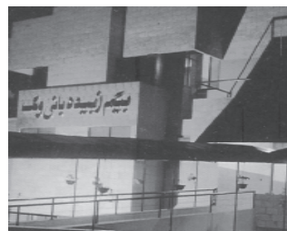
ബീഗം സുബൈദാ ബാനി വിംഗ്

ഫസ്ലെ ഉമർ ആശുപത്രി കെട്ടിടത്തിന്റെ തറക്കല്ലിടൽ ചടങ്ങ് 1956-ൽ മുസ്ലീഫ് മൗലുദ്ദീൻ മായ ഫെബ്രുവരി 20-ന് ഖലീഫത്തുൽ മസീഫ് രണ്ടാമൻ ഹദ്ദറത്ത് മിർസാ ബശീറുദ്ദീൻ മഹ്മൂദ്ഹദ്ദ് സാഹിബ്(റ) നിർവ്വഹിച്ചു. അഹ്മ