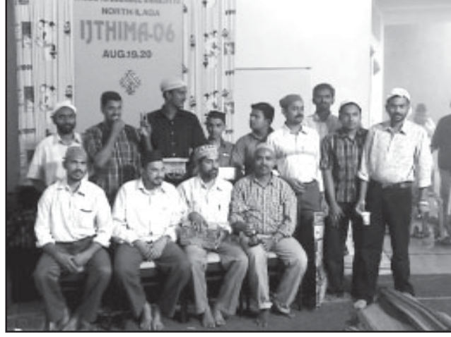
ഖുദ്രാമുൽ അഹ്മദിയ്യാ നോർത്ത് ഇലാഖാ ഇജ്തിമായിൽ ചാമ്പ്യന്മാരായ മാത്തോട്ടം മജ്ലിസ് അംഗങ്ങൾ ഇലാഖാ ഖാഇദ് സാഹിബിന്റെ കൂടെ

സൗജന്യവൈദ്യ സഹായങ്ങൾ നല്കുന്നതാണ്. ന്യൂറോസർജറി, പീഡിയട്രിക്, പെയിൻ കെയർ തുടങ്ങിയ വൈദ്യമേഖലകളിലെ പ്രഗത്ഭന്മാർ അടങ്ങിയ ഈ സംഘം ഘാനയുടെ ആരോഗ്യമന്ത്രാലയവുമായി സഹകരിച്ചാണ് പ്രവർത്തിക്കുക.