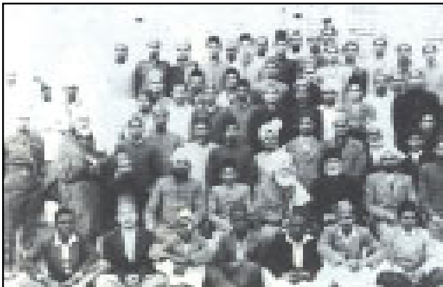
ഖലീഫത്തുൽ മസീഹ് സാനി (റ) ജമാഅത്ത് അംഗങ്ങളോടൊപ്പം. സമീപം ചൗധരി മുഹമ്മദ് സഹറുല്ലാഖാൻ സാഹിബിനെ യും കാണാം.

കേൾക്കുക. വിജ്ഞാനപ്രദമായ മറ്റു പരിപാടികളിലേ തെങ്കിലും കാണുന്ന ശീലം വളർത്തിയെടുക്കുക. വളരെ നല്ല പരിപാടികൾ സംഘ്രഷണം ചെയ്തു വരുന്നുണ്ട്. ക്ലാസുകളിലൂടെ ലഭിച്ച പാഠങ്ങൾ ജീവിതത്തിൽ ശീലമാക്കുക. സ്വയം ശിക്ഷണം ലഭിച്ചവരായാലേ ഭാവിയിൽ മറ്റുള്ളവർക്ക് അത് കൈമാറാൻ സാധിക്കുകയുള്ളൂ.