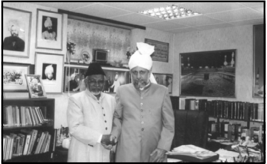
അഹ്മദിയ്യാ മുസ്ലിം ജമാഅത്തിന്റെ ആഗോള ഇമാം ഖലീഫത്തുൽ മസീഹ് മിർസാ മസ്റൂർ അഹ്മദ് സാഹിബിനെ (അയ്യൂദഹു) ലണ്ടനിൽ വെച്ച് ലേഖകൻ സന്ദർശിച്ചപ്പോൾ.

ഒ രു കാലത്ത് സൂര്യനസ്തമിക്കാത്ത സാമ്രാജ്യത്തിന്റെ ആസ്ഥാനമായിരുന്നു ലണ്ടൻ. കോളോണിയലിസത്തിന്റെ അവസാനത്തോടെ ബ്രിട്ടീഷ് സാമ്രാജ്യം അതിന്റെ സ്വന്തം രാജ്യം തിരിച്ചറിയാൻ ചുരുങ്ങിയ പടിഞ്ഞാറിന്റെയും കിഴക്കിന്റെയും സംഗമസ്ഥാനം എന്നറിയപ്പെടുന്ന ലണ്ടൻ പട്ടണം പ്രവാസികളായ ലോക നേതാക്കന്മാരുടെ അന്തർദേശീയ കേന്ദ്രവും കൂടിയാണ്. ലണ്ടൻ പട്ടണം സൂര്യനസ്തമിക്കാത്ത മറ്റൊരു സാമ്രാജ്യത്തിന്റെ കേന്ദ്രമാവുകയാണ്. ഭൂമിയുടെ കോണുകളോളമുള്ള 176 രാജ്യങ്ങളിൽ വ്യാപിച്ചു കിടക്കുന്ന അഹ്മദിയ്യാ മുസ്ലിം ജമാഅത്ത് ഇന്ന് നിയന്ത്രിക്കപ്പെടുന്നത് പ്രവാസ കേന്ദ്രമായ ലണ്ടനിൽ നിന്നാണ്. 1984 ൽ ഖലീഫത്തുൽ മസീഹ് നാലാമൻ പാക്കിസ്ഥാനിൽ നിന്നും ലണ്ടൻ ലേക്ക് ഹിജ്റത്ത് ചെയ്ത് വന്നതു മുതൽ ജമാഅത്തിന്റെ ലണ്ടനിലെ വാർഷിക സമ്മേളനങ്ങൾ അഹ്മദിയ്യാ ജമാഅത്തിന്റെ അന്തർദേശീയ സമ്മേളനങ്ങളായി മാറുകയായിരുന്നു. ഖലീഫത്തുൽ മസീഹ് അഞ്ചാമൻ മിർസാ മസ്റൂർ അഹ്മദിന്റെ (അയ്യൂദഹു) നേതൃത്വത്തിൽ 37-ാമത് യു. കെ