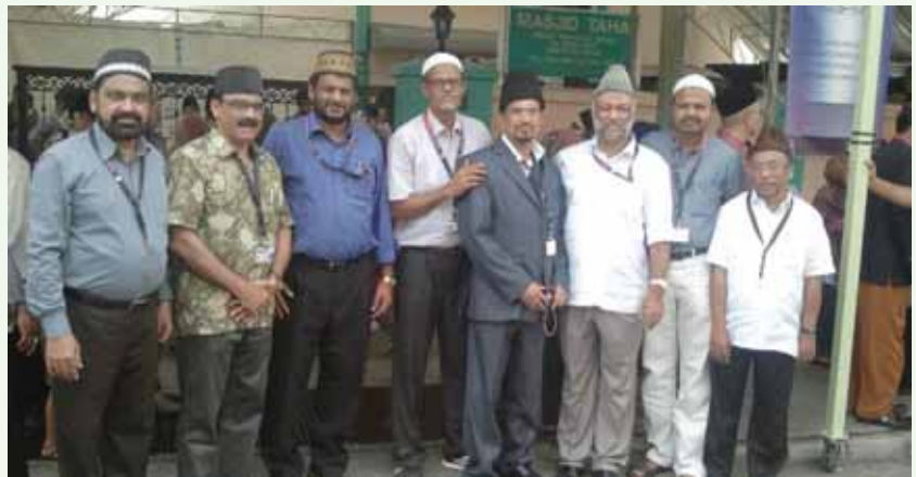
കേരളത്തിൽ നിന്നുള്ള പ്രതിനിധികൾ ഖിലാഫത്തുൽ മസീദിനെ സന്ദർശിക്കുന്നതിനായി സിംഗപ്പൂർ മസ്ജിദ് താഹയിലെത്തിയപ്പോൾ.