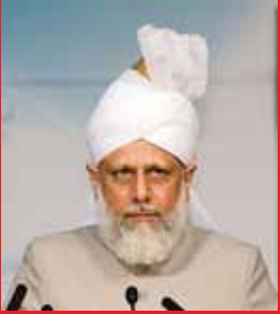
മുതബ്ബി സിറിയ: പ്രശ്നവും പരിഹാരവും