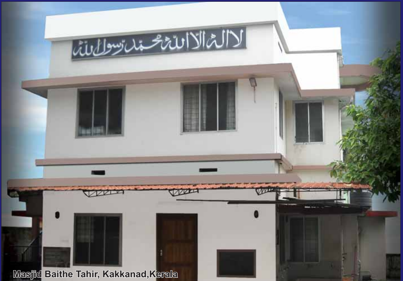
Masjid Baithe Tahir, Kakkanad, Kerala