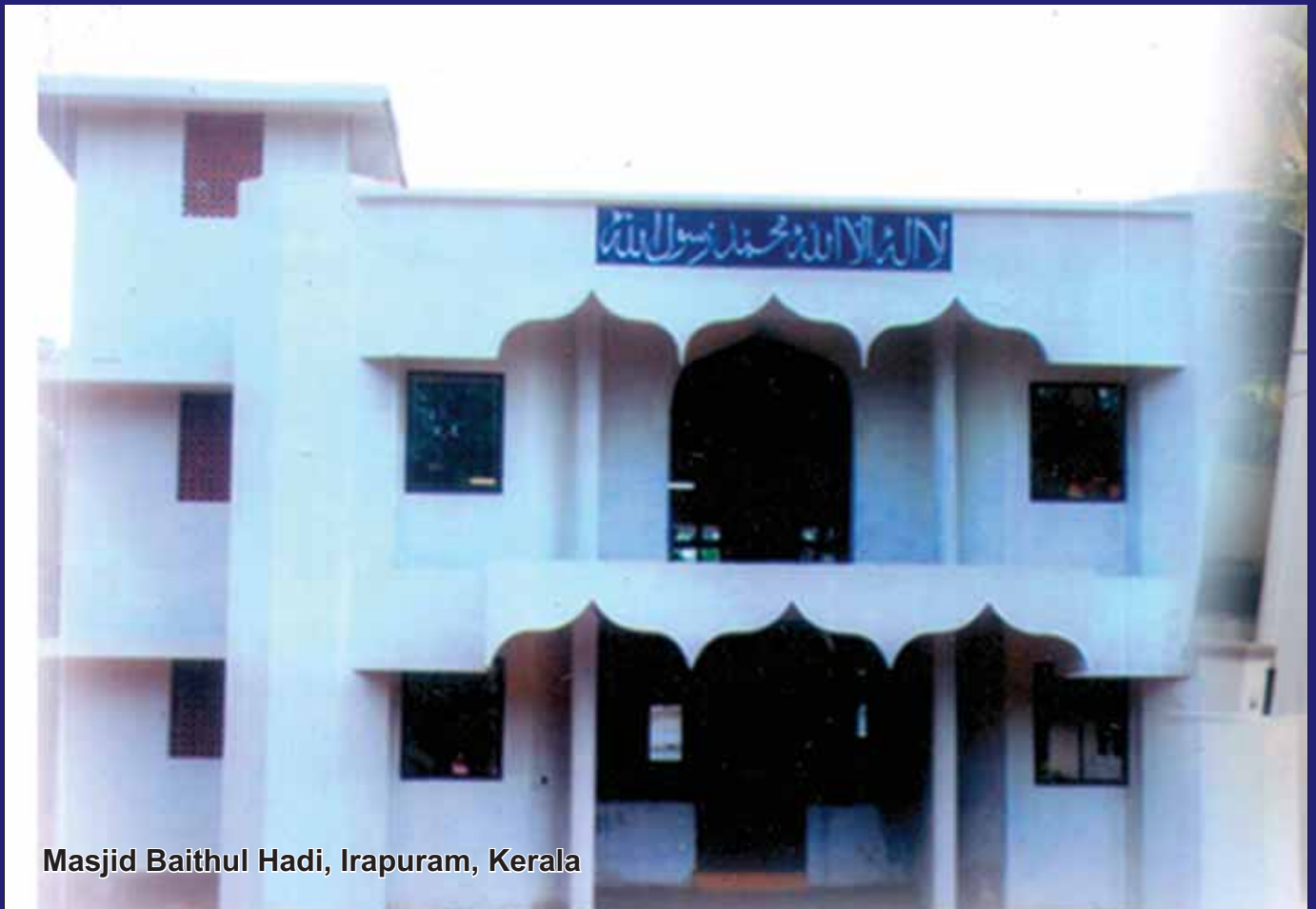
Masjid Baithul Hadi, Irapuram, Kerala