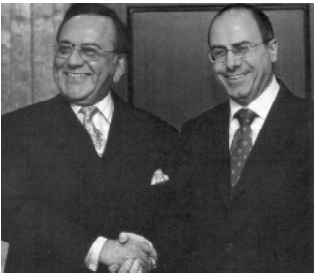
പാകിസ്താൻ വിദേശകാര്യമന്ത്രി മുർഷിദ് അഹ്മദ് കസൂരിയും ഇസ്രായേൽ വിദേശകാര്യമന്ത്രി സിൽവാൻ ശാലോമും ഇസ്താബൂളിൽ വെച്ച് നടത്തിയ കൂടിക്കാഴ്ചാവേളയിൽ

ക്കാനുള്ള പ്രവർത്തനത്തിന്റെ കരുക്കൾ അമേരിക്കയും ഇസ്രായേലും നീക്കിതുടങ്ങിയിരിക്കുകയാണല്ലോ. ശത്രുക്കളുടെ ആണവ - ജൈവ - രാസായുധകേന്ദ്രങ്ങളിൽ സിവിലിയൻ അധികാരികളുടെ അനുമതിയില്ലാതെ ഇനി മുതൽ അമേരിക്കൻ സൈന്യത്തിന് ആറ്റോബോംബ് വർഷിക്കാം എന്ന നിയമം അമേരിക്കൻ ഭരണകൂടം പാസാക്കാൻ പോവുകയാണ്. ഈ വസ്തുത കൂടി ഇതിനോടു ചേർത്ത് വായിക്കണം. പാകിസ്താനുമായി നയതന്ത്രബന്ധം സ്ഥാപിക്കുന്ന ഇസ്രായേലും അമേരിക്കയും ചേർന്ന് ഇന്ത്യയെ ഇറാനിൽ നിന്നും അകറ്റിയിരിക്കുകയാണ്. ഇന്ത്യയുടെ ഊർജ്ജാവശ്യങ്ങൾക്ക് ഗണ്യമായി സഹായകരമായ ഇറാനിൽ നിന്നുള്ള പ്രകൃതിവാതക ഇന്ധ