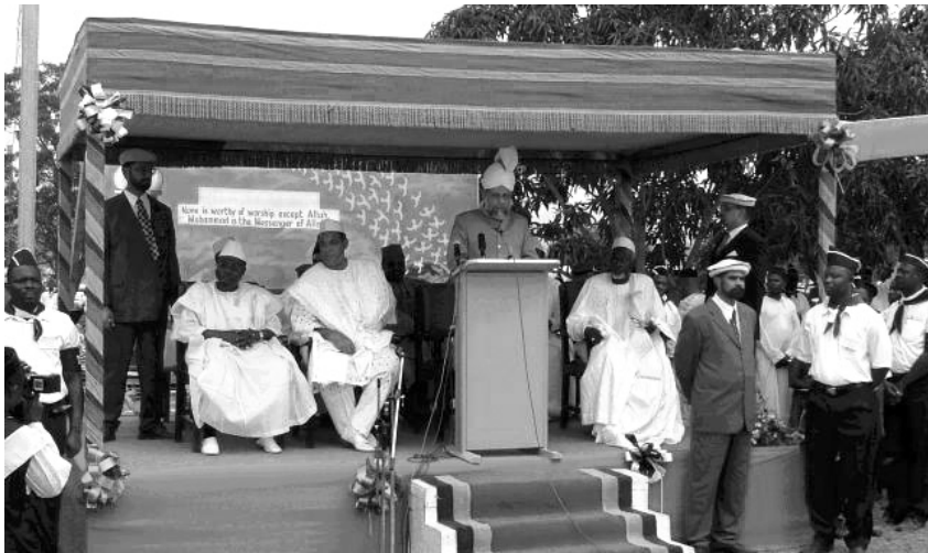
പശ്ചിമാഫ്രിക്കയിൽ ഘാനയിലെ വാർഷിക സമ്മേളനത്തിൽ ഖലീഫത്തുൽ മസീഹ് V തിരുമനസ്സ് പ്രസംഗിക്കുന്നു.

മാർച്ച് 14-ാം ഹുസുർ ജമാഅത്തിന്റെ വിവിധ സ്ഥാപനങ്ങൾ സന്ദർശിക്കുകയും അഗോണ സിഡ്രൂവിലെ ഉന്നതനിലവാരമുള്ള ആശുപത്രി ഉദ്ഘാടനം ചെയ്യുകയും ചെയ്തു. മാർച്ച് 15-ാം ഘാനാ പ്രസിഡണ്ടിന്റെ ക്ഷണപ്രകാരം അദ്ദേഹത്തിന്റെ വസതിയിൽ വെച്ച് നടന്ന കുടിക്കാഴ്ചയിൽ അഹ്മദിയ്യാ ജമാഅത്ത് അവിടങ്ങളിൽ ചെയ്യുന്ന ജീവകാരുണ്യ പ്രവർത്തനങ്ങളെ ഘാനാ പ്രസിഡണ്ട് വളരെ ശ്ലാഘിക്കുകയും ഹുസുറിന്റെ തിരുസന്നിധിയിൽ ദുആക്കുപേക്ഷിക്കുകയും ചെയ്തു. അന്നുതന്നെ ടേമ എന്ന സ്ഥലത്തെ ജമാഅത്തിലെ വിവിധ സ്ഥാപനങ്ങൾ സന്ദർശിച്ചു. 16-ാം നു ആഫ്രിക്കയിലെ വിവിധ സ്ഥലങ്ങൾ സന്ദർശിച്ചു പോലീസുകമ്പടിയോടെ യായിരുന്നു ഹുസുറിന്റെ യാത്ര. 17. 3. 04 ന് ഹുസുർ മുബല്ലിഗുമാരുമായി കൂടി