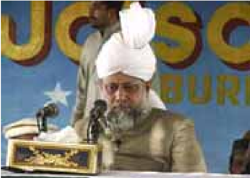
ബോർക്കിനോഫോസോയിലെ വാർഷിക സമ്മേളനത്തിൽ ഹുസൂർ തിരുമനസ്സ് (അയ്യപ്പൻ) പ്രസംഗിക്കുന്നു.

ഹുസൂറും ബോർക്കിനോഫോസോ അതിർത്തിയിൽ പ്രവേശിച്ചു.