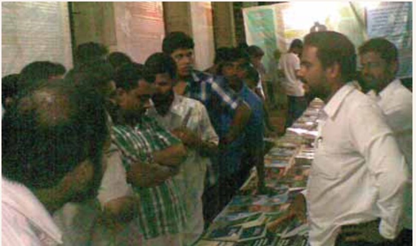
കോട്ടക്കലിൽ വച്ച് നടന്ന അഹ്മദിയ്യാ ബുക്ക്സ്റ്റാൾ