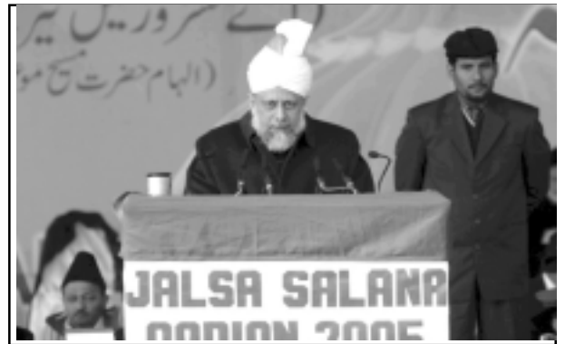
ഹുസൂർ തിരുമനസ്സ് സദസ്സിനെ അഭിസംബോധന ചെയ്യുന്നു