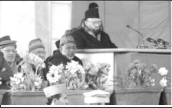
നാസിർ അഅ്ലാ ഹദ്റത്ത് മിർസാ വസീം അഹ്മദ് സാഹിബ് സദസ്സിനെ അഭിസംബോധനം ചെയ്യുന്നു.