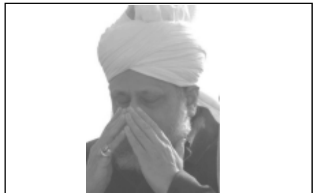
ഹുസൂർ തിരുമനസ്സ് ഉപസംഹാര പ്രസംഗത്തിനുശേഷം പ്രാർത്ഥനക്ക് നേതൃത്വം നൽകുന്നു.