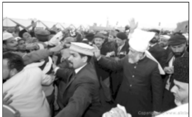
ഹുസുർ തിരുമനസ്സ് ജനക്കൂട്ടത്തിൽ