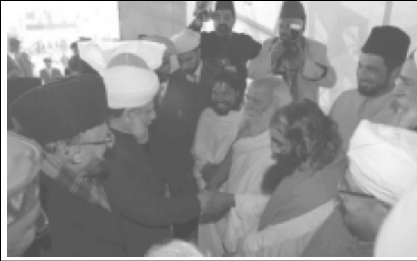
ഹുസുർ തിരുമനസ്സ് മത നേതാക്കളോടൊപ്പം