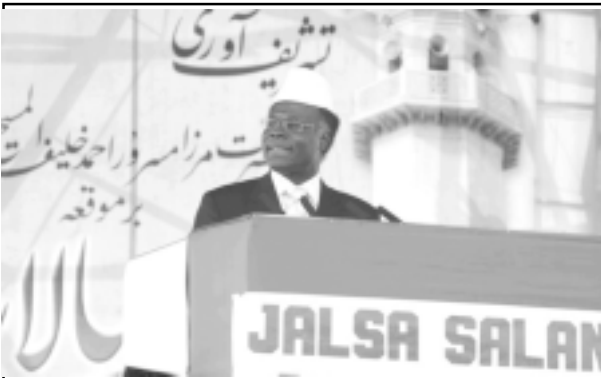
ഘാനയിൽ നിന്നുള്ള പ്രതിനിധി