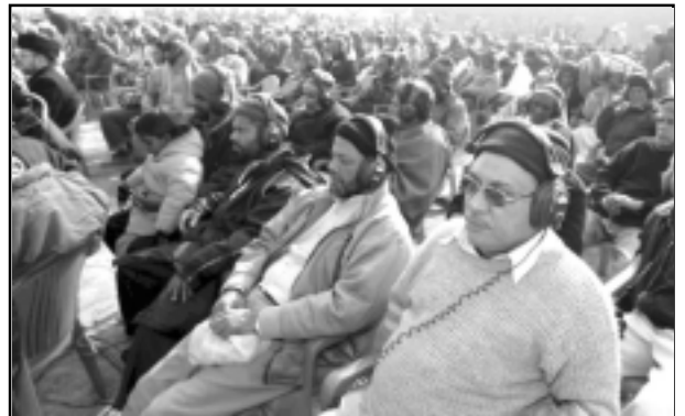
കേരളത്തിൽ നിന്നുള്ള പ്രതിനിധികൾ