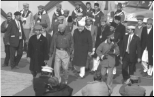
ഹുസൂർ തിരുമനസ്സ് ജൽസാ ഗാഹിലേക്ക്