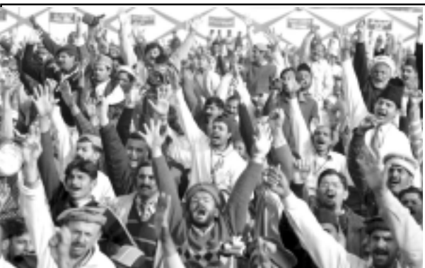
സദസ്സ് ആവേശത്ത തിമിർപ്പിൽ