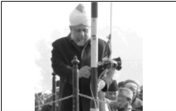
അഹ്മദിയ്യാ പതാക വിണ്ണിലേക്ക്