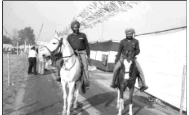
സമ്മേളന നഗരിയെ റോത്ത് ചുറ്റുന്ന അശ്വഭടന്മാർ