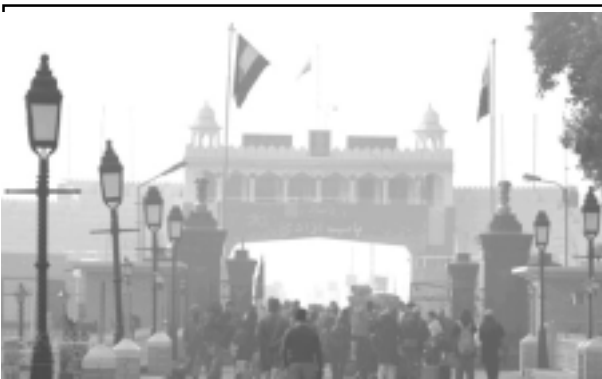
പാകിസ്താനിൽ നിന്നുള്ള പ്രതിനിധികൾ വാഗാ അതിർത്തിയിൽ