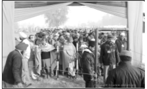
ജൽസാ ഗാഹിലേക്ക് ജന പ്രവാഹം