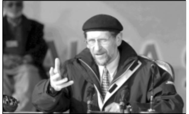
ജർമ്മൻ അമീർ സദസ്സിനെ അഭിസംബോധനം ചെയ്യുന്നു.