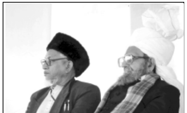
ബംഗാൾ അമീർ മൾതിക് അലി സാഹിബ്, ദോസ്ത് മുഹമ്മദ് ശാഹിദ് സാഹിബ്