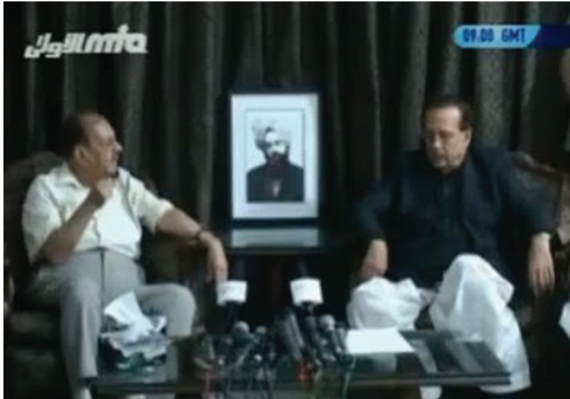
ലാഹോർ അഹ്മദിയ്യാ മസ്ജിദ് ആക്രമണത്തിന് ശേഷം അഹ്മദിയ്യാ ആസ്ഥാനത്ത് അനുശോചനമറിയിക്കാൻ സൽമാൻ തയ്സീർ (വലത്ത്) വന്നപ്പോൾ

പഞ്ചാബ് ഗവർണ്ണർ സൽമാൻ തയ്സീർ വധിക്കപ്പെട്ട സംഭവം ആസിയാ ബീവി എന്ന ക്രിസ്തീയ വനിതയുമായി ബന്ധപ്പെട്ട മതനിന്ദാ കേസാണ്. 2009 ലാണ് കേസിനാസ്പദമായ സംഭവം നടന്നത്. ക്രിസ്ത്യാനിയായ ആസിയാ ബീവി സ്പർശിച്ച ഗ്ലാസിൽ വെള്ളം കുടിക്കാൻ രണ്ട് മുസ്ലിം സ്ത്രീകൾ വിസമ്മതിക്കുകയുണ്ടായി. ഇതിനെ തുടർന്ന് ഗ്രാമീണരായ വീട്ടമ്മമാർ തമ്മിൽ നടന്ന വഴക്കിലാണ് മുഹമ്മദ് നബി (സ) യെ അധിക്ഷേപിച്ചുകൊണ്ട് ആസിയാ ബീവി സംസാരിച്ചു എന്ന ആരോപണമുണ്ടായത്. കേസ് സെഷൻസ് കോടതിയിൽ വിചാരണക്ക് വരികയും ആസിയാ ബീവിയെ വധശിക്ഷക്ക് വിധിക്കുകയുമുണ്ടായി. മതനിന്ദയുമായി ബന്ധപ്പെട്ട പാക്കിസ്ഥാനിലെ ആദ്യത്തെ വധശിക്ഷ വിധിയാണിത്. അതിനുശേഷം പഞ്ചാബ് ഗവർണ്ണറായ സൽമാൻ തയ്സീർ ശൈഖ്പൂരിലെ ജയിലിൽ വന്ന് ആസിയാ ബീവിയെ സന്ദർശിക്കുകയും അവിടെ വെച്ച് അവരോടൊപ്പം ഒരു പത്രസമ്മേളനം നടത്തുകയും ചെയ്തു. പാക്കിസ്ഥാൻ