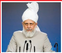
'റസൂൽ (സ) തിരുമേനി' മാപ്പരുളിയ മഹാപ്രവാചകൻ