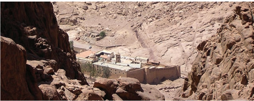
കോഡക്സ് സിനായിറ്റിക്കസ് കണ്ടെടുത്ത ഈജിപ്തിലെ സെന്റ് കാതറിൻ ചർച്ച്

കോഡക്സ് സിനായിറ്റിക്കസ് എഴുതപ്പെട്ടതിന് ശേഷവും അതിന്റെ സംശോധകർ ഒരുപാട് കൂട്ടിച്ചേർത്തലുകൾ നടത്തിയിട്ടുണ്ട്. എല്ലാ സംശോധകരും അവരുടെ വിശ്വാസ സിദ്ധാന്തങ്ങൾ അതിൽ എഴുതി ചേർത്ത് യഥാർത്ഥ പാഠങ്ങൾ മാറ്റിത്തീർത്തുകയാണുണ്ടായത്. പക്ഷേ പിൽക്കാലത്തുള്ള സംശോധകർ മാറ്റത്തിരുത്തലുകൾ കണ്ടെത്തുകയും ആ തിരുത്തലുകൾ ശരിയാക്കാൻ ശ്രമിക്കുകയും ചെയ്തിട്ടുണ്ട്. പകർത്തിയെഴുത്തുകാർ അവരുടെ ചില പകർപ്പുകളിൽ കൂത്തുകളും ബ്രാക്കറ്റുകളും ഇട്ടതായി കാണുന്നു. ക്രിസ്തീയ വിശ്വാസത്തിനനുസൃതമായി മാറ്റി