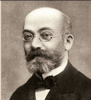
ഡോ. ലൂഡ്വിക് ലാസറസ് സാമൻ ഹോഫ്

ഭാഷാപരമായ കലഹമില്ലാതാക്കാൻ വേണ്ടി പോളണ്ടിലെ ഭാഷാ വിദഗ്ദ്ധനായ ഡോക്ടർ ലൂഡ്വിക് ലാസറസ് സാമൻ ഹോഫ് (1859-1917) ആവിഷ്കരിച്ച ഒരു കൃത്രിമ ലോകഭാഷയാണ് ‘പ്രതീക്ഷിച്ചിരിക്കുന്ന ആൾ’ എന്നർത്ഥമുള്ള എസ് പരാന്റോ. ഡോക്ടർ ലൂഡ്വിക് സ്വയം തന്നെ പേര് മാറ്റി എസ് പരാന്റോ എന്ന പേര് സ്വീകരിക്കുകയുണ്ടായി.