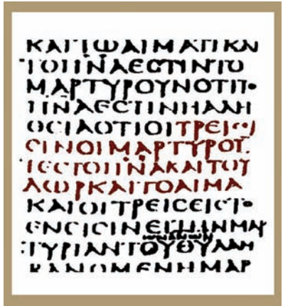
കോഡക്സ് സിനായിറ്റിക്കസിന്റെ ഗ്രീക്ക് ഭാഷയിലുള്ള ലിഖിതങ്ങൾ

മരിച്ചവരുടെ ഇടയിൽ നിന്ന് ഉയിർത്തെഴുന്നേറ്റു യേശുവിനെ അവഗണിച്ചിരിക്കുന്നതായി കാണാം. ഈ ഒരു സ്ഥിരീകരണം വ്യക്തമായും സ്പഷ്ടമായും ഒരു വിശ്വാസത്തിലേക്ക് നമ്മെ നയിക്കുന്നു. അതായത് ഏത് വിധേനയായാലും യേശു അപ്പോഴും ജീവിച്ചിരുന്നു എന്നു മാത്രമല്ല അദ്ദേഹം തന്റെ ശിഷ്യന്മാർക്ക്, കുരിശ് സംഭവത്തിനുശേഷം ശരീരത്തോടു കൂടി തന്നെയായിരുന്നു പ്രത്യക്ഷമായത് എന്നുമാണ് അത്. യേശു തന്നെ താഴെ പറയുന്ന വചനങ്ങളിൽ ഇപ്രകാരം വ്യക്തമാക്കുന്നു.