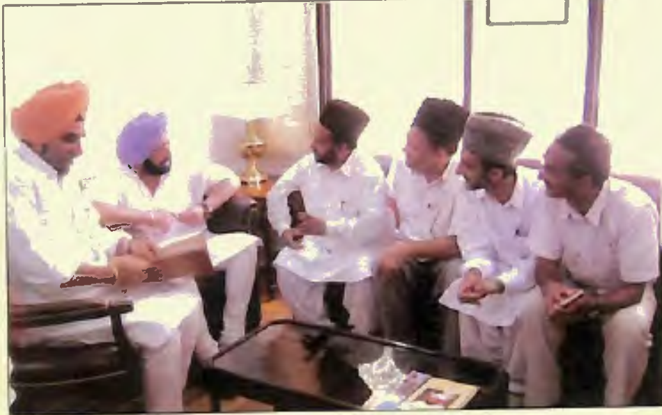
پنجاب بھون، چنڑی گڑھ میں وزیر اعلیٰ پنجاب جناب کیشن امر ندر سنگھ صاحب سے جماعتی وفد کی ملاقات