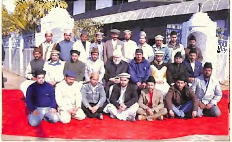
مجلس عاملہ خدام الاحمدیہ بھارت (7 جنوری 2006)