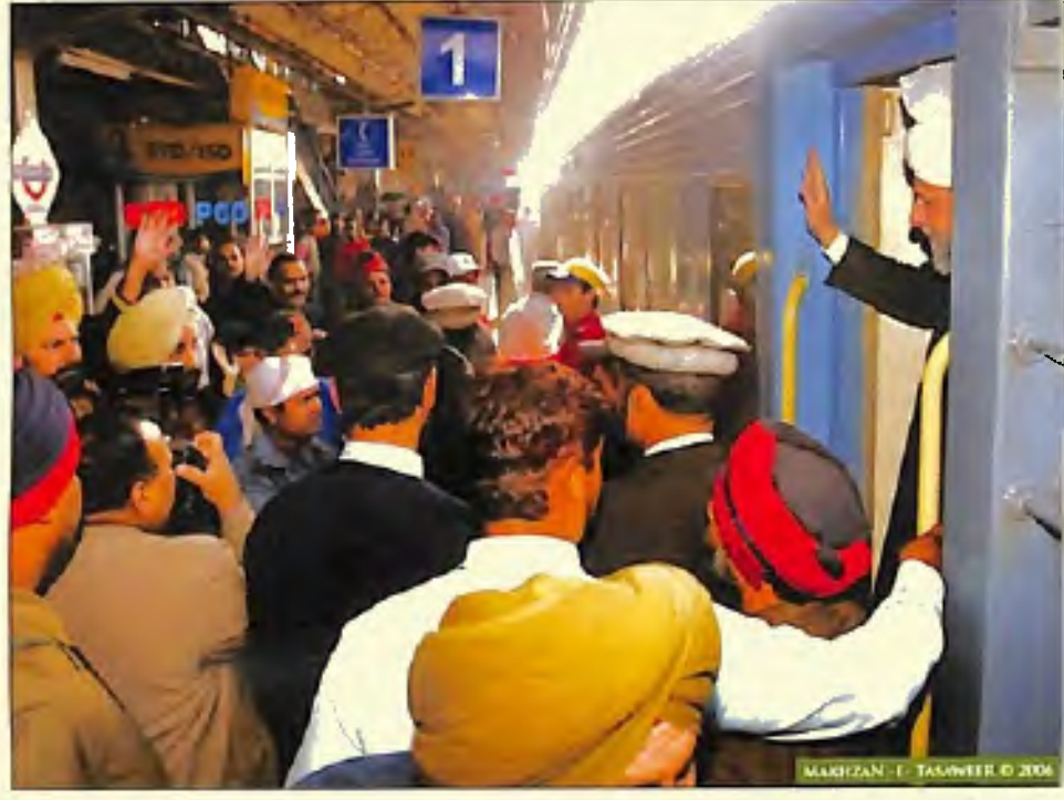
امر ترقیوے ٹیشن پر حضور انور ایدہ اللہ تعالیٰ کا استقبال (15 دسمبر 2005)