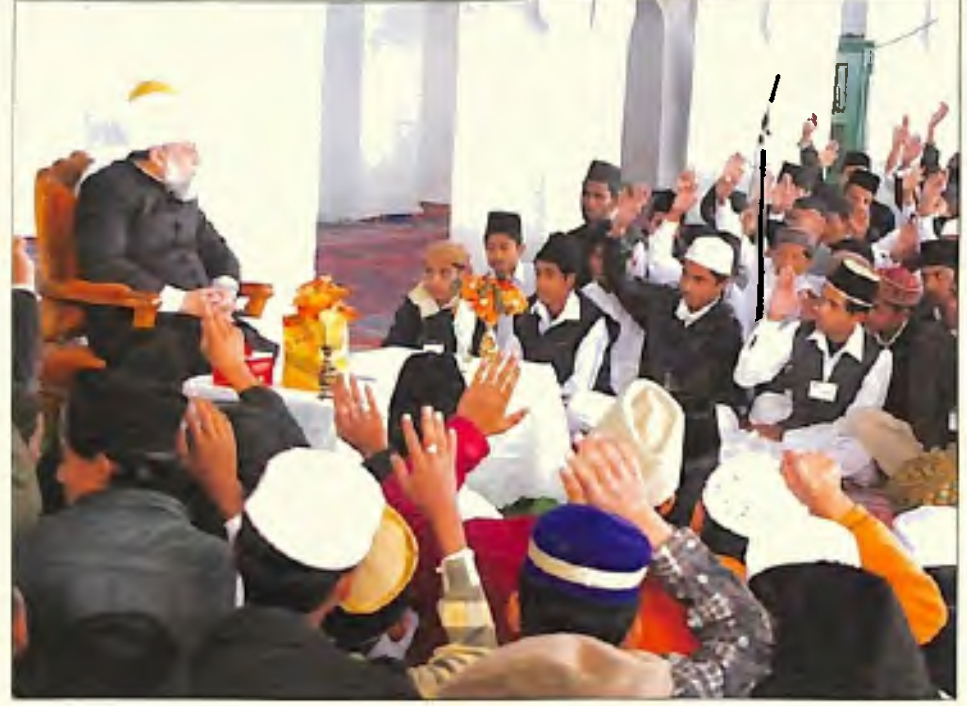
حضرت امیر المؤمنین ایدہ اللہ تعالیٰ بنصرہ العزیز قادیان کے واقعین نوکی کا اس میں (5 جنوری 2006)