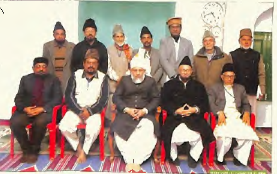
امراء جماعت بائیں احمدیہ بھارت