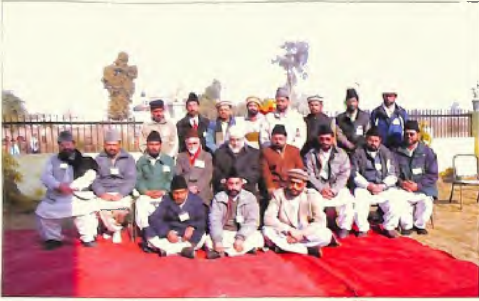
مجلس عاملہ انصار اللہ بھارت (7 جنوری 2006)