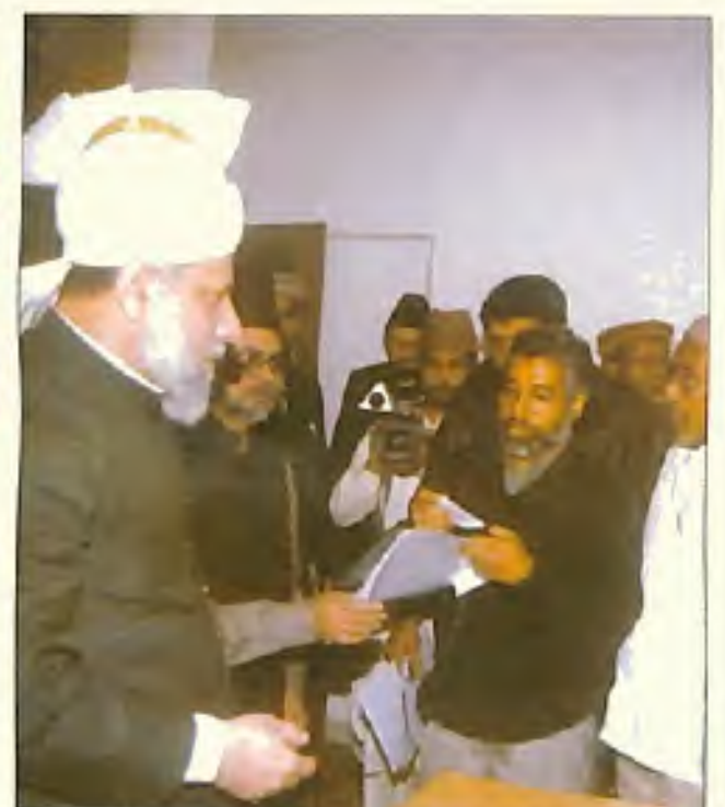
دہلی میں پریس کانفرنس کے دوران حضور انور نامہ نگاروں کے سوالات کے جوابات دیتے ہوئے (14 دسمبر 2005)