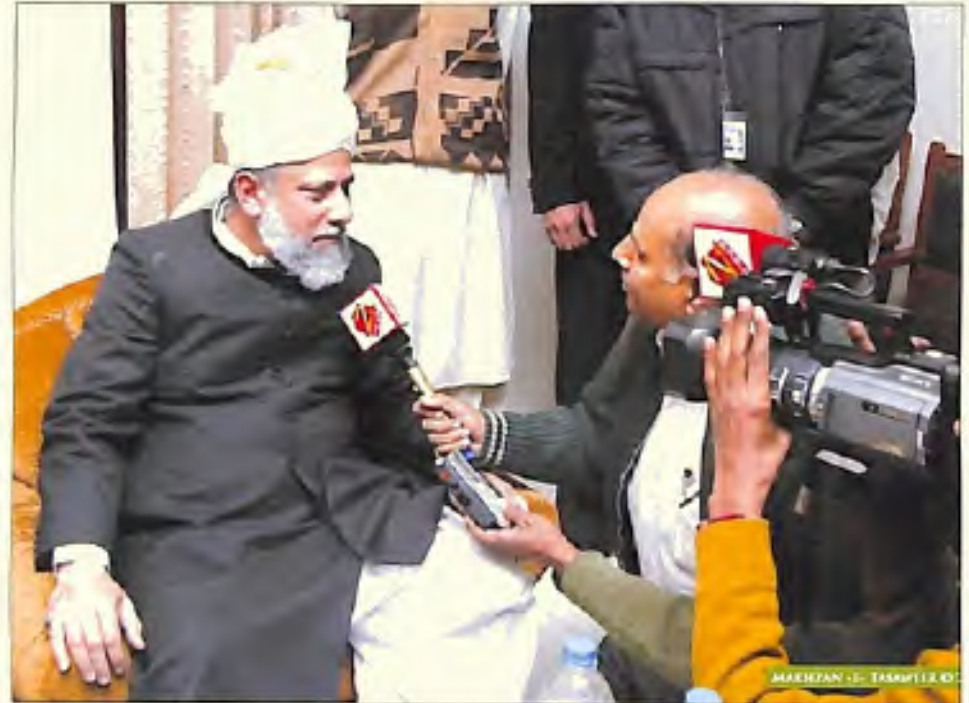
زی نیوز کے نمائندے حضور انور سے گفتگو کرتے ہوئے