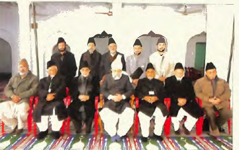
ممبران صدر انجمن احمدیہ ربوہ (4 جنوری 2006)