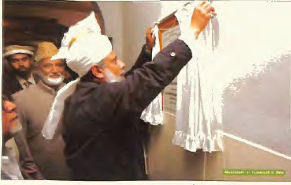
سیدنا حضرت امیر المؤمنین ایدہ اللہ تعالیٰ بنصرہ العزیز جدید نور ہسپتال قادیان کا افتتاح کرتے ہوئے (2 جنوری 2006)