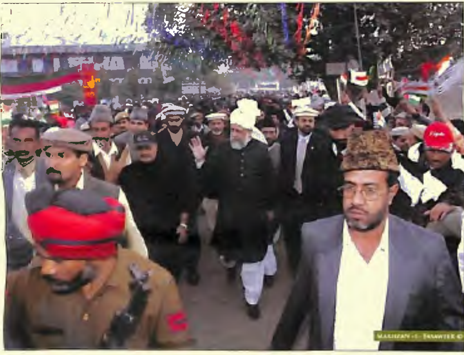
حضرت امیر المؤمنین ایدہ اللہ تعالیٰ بنصرہ العزیز کا دیان آمد پر احباب کا دیان کے استقبال کا جواب دیتے ہوئے (15 دسمبر 2005)