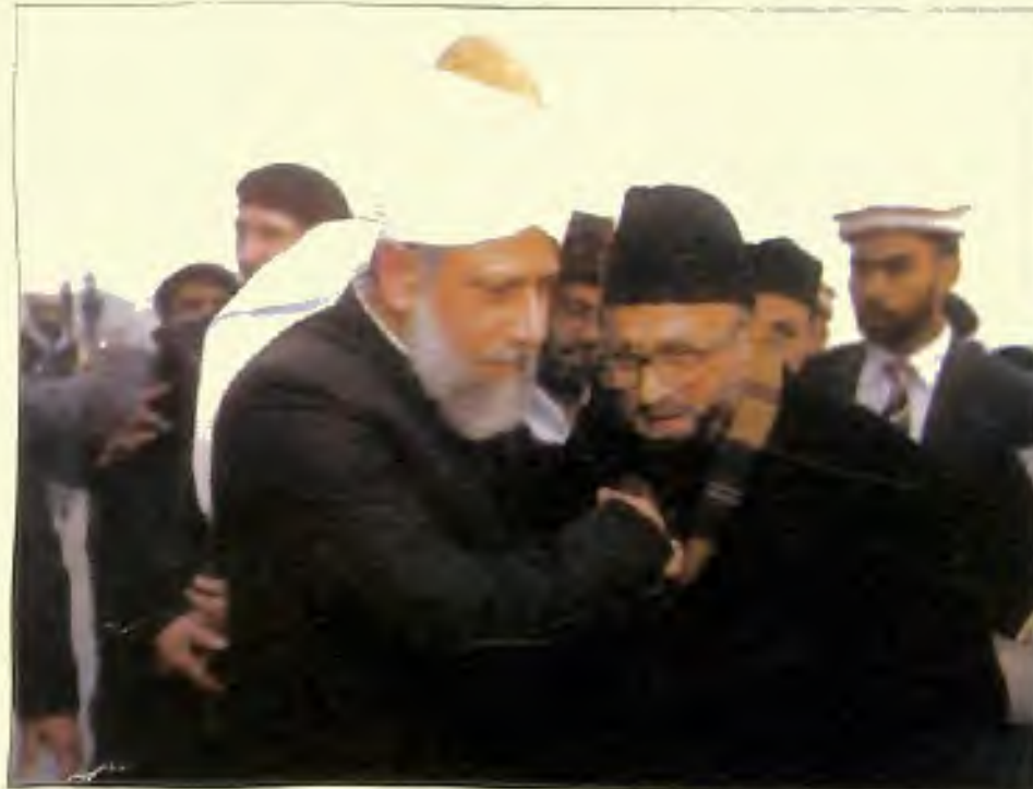
حضرت صاحبزادہ مرزا وسیم احمد صاحب ناظر اعلیٰ و امیر جماعت احمدیہ کا دیان حضور ایدہ اللہ تعالیٰ بنصرہ العزیز سے ملاقات کا شرف حاصل کرتے ہوئے (15 دسمبر 2005)