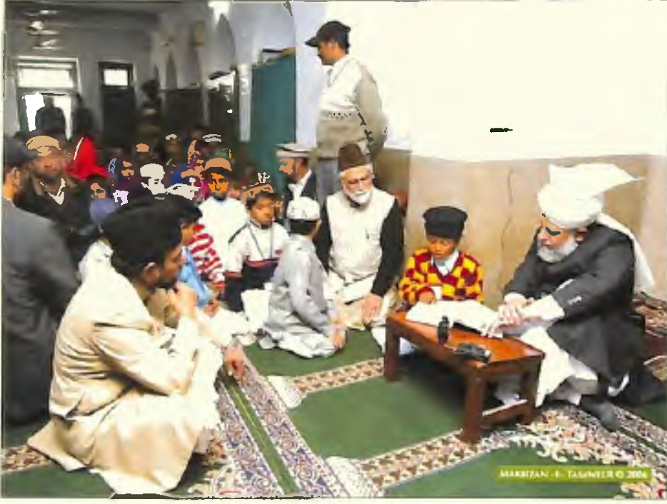
حضرت امیر المؤمنین ایدہ اللہ تعالیٰ بنصرہ العزیز تقریب آئین کے موقع پر (4 جنوری 2006)