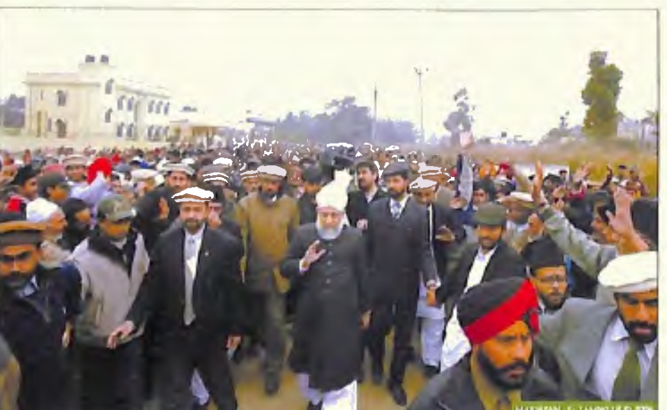
رواگی سے قبل حضور ایدہ اللہ تعالیٰ بنصرہ العزیز احباب قادیان کے الوداع کا جواب دیتے ہوئے