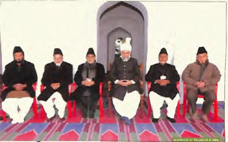
اراکین مرکزی وفد ربوہ جو جلسہ سالانہ 2005 کے انتظامات کے لئے جلسہ سے قبل تشریف لائے