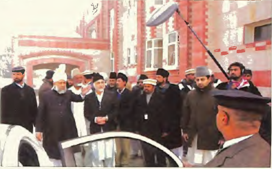
حضور ایدہ اللہ تعالیٰ بنصرہ العزیز سرائے طاہر قادیان میں (23 دسمبر 2005)