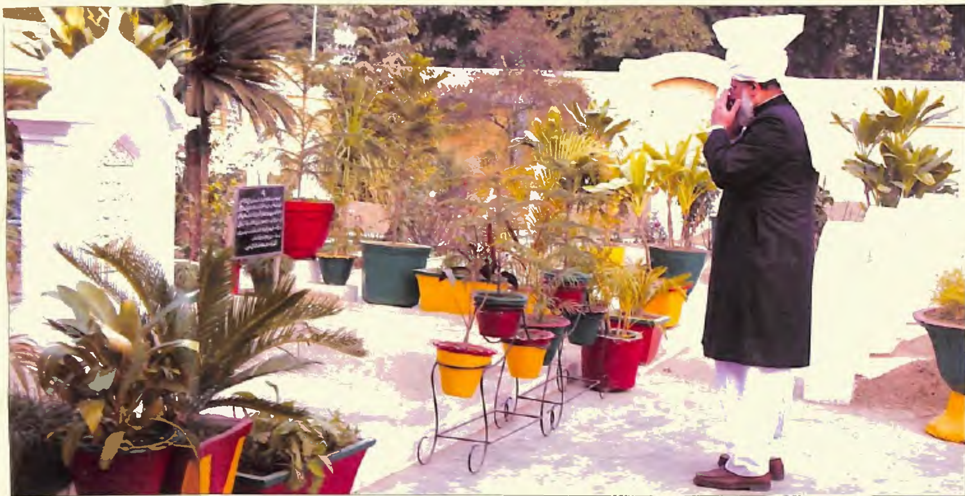
سیدنا حضرت امیر المؤمنین خلیفۃ المسیح الخامس ایدہ اللہ تعالیٰ بنصرہ العزیز بہشتی مقبرہ قادیان میں مزار مبارک سیدنا حضرت اقدس مسیح موعود علیہ السلام پر دعوتے ہوئے