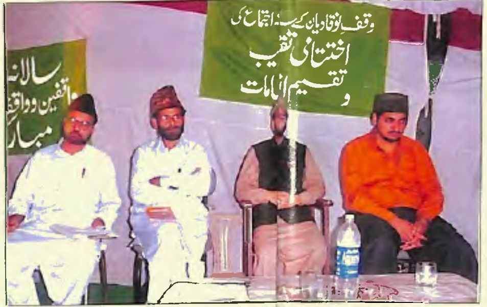
وقف نوقاد سالانہ اجتماع، شیخ کا منظر