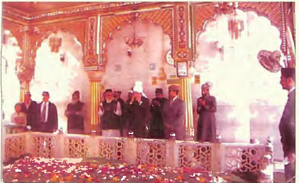
حضور ایہ اللہ تعالیٰ بنصرہ العزیز خواجہ قطب الدین بختیار کاکی رحمۃ اللہ علیہ کے مزار پر دعا کرتے ہوئے