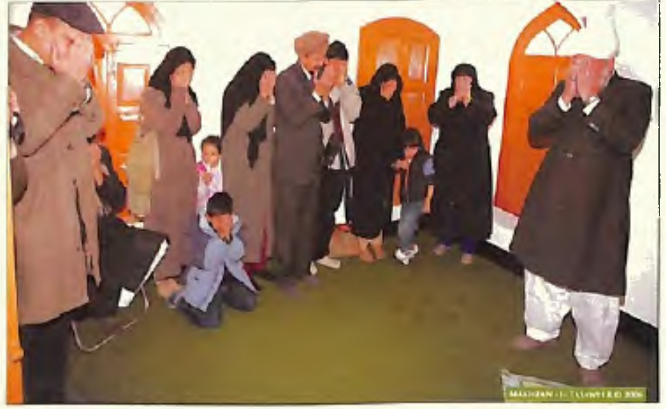
ہوشیار پور میں اس مقام پر جہاں حضرت اندس مسیح موعود علیہ السلام نے چلہ کشی کی حضور انور موجود تھے (8 جنوری 2006)