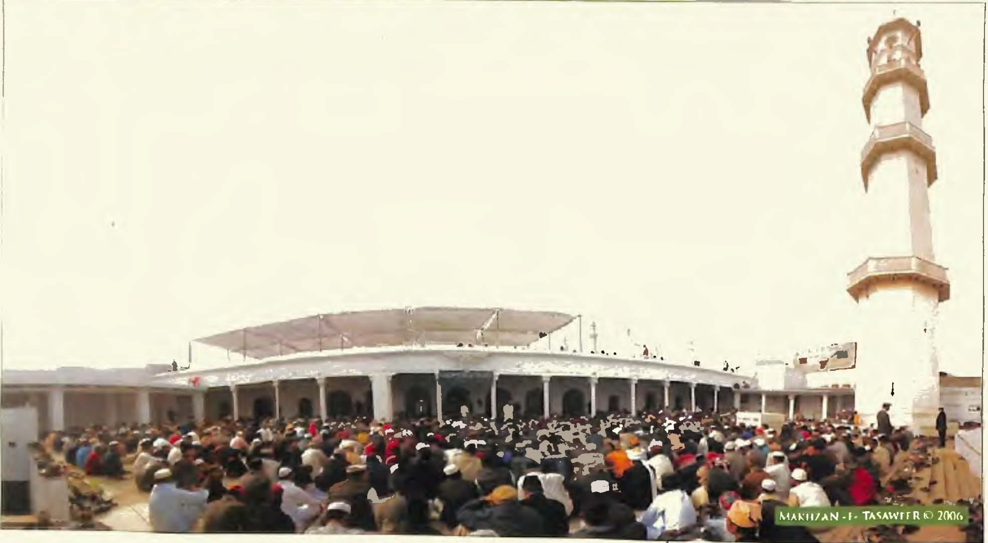
سیدنا حضرت اقدس امیر المؤمنین خلیفۃ المسیح الخامس ایدہ اللہ تعالیٰ بنصرہ العزیز کا تاریخی خطبہ جمعہ جو 16 دسمبر 2005ء کو مسجد اقصیٰ قادیان دارالامان سے مسلم ٹیلی ویژن احمدیہ کے ذریعہ پوری دنیا میں ٹیلی کاسٹ ہوا جس کے ذریعہ حضرت مسیح موعود علیہ السلام کا الہام "میں تیری تبلیغ کو زمین کے کناروں تک پہنچاؤں گا" نہایت شان کے ساتھ پورا ہوا۔ اوپر خطبہ جمعہ دیتے ہوئے حضور ایدہ اللہ تعالیٰ اور نیچے مسجد اقصیٰ میں خطبہ جمعہ کے وقت سامعین کا ایک منظر