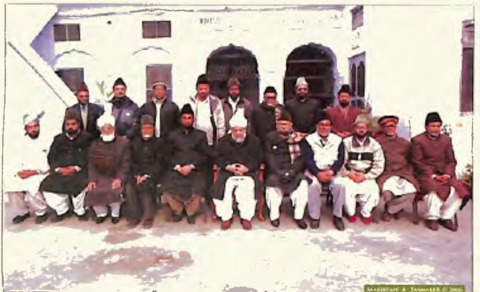
ممبران صدر انجمن احمدیہ قادیان حضور ایدہ اللہ تعالیٰ بنصرہ العزیز کے ہمراہ (9 جنوری 2006)