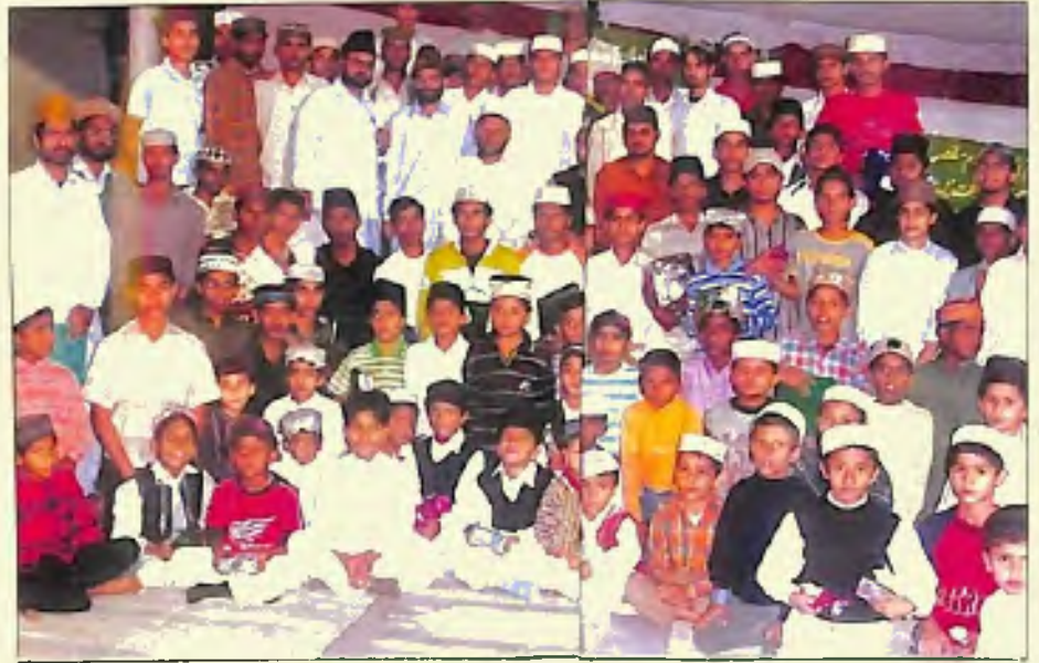
وقف نوقاد سالانہ اجتماع، گروپ فوٹو