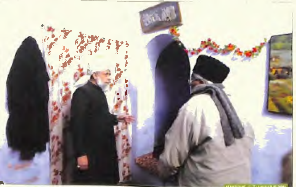
حضور ایہ اللہ تعالیٰ بنصرہ العزیز مکان حضرت خلیفۃ المسیح الاول علیہ السلام