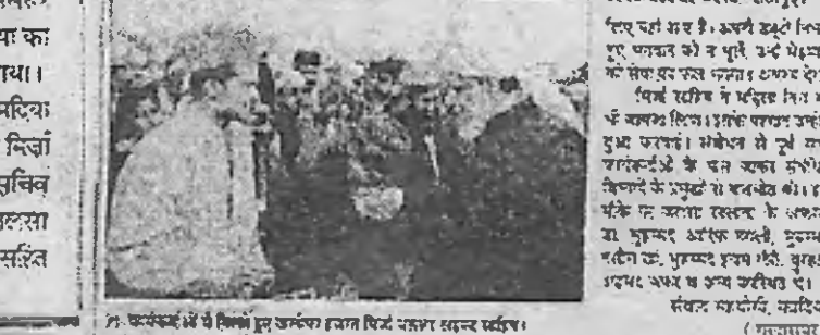
खलीफा मसूर ने लिया प्रबंधों का जायजा...