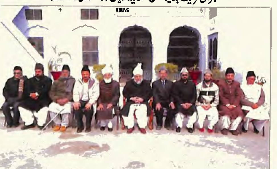
ممبران وفد جدید انجمن احمدیہ قادیان (9 جنوری 2006)