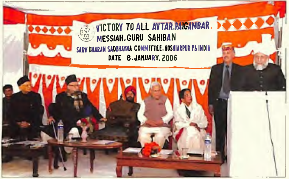
ہمالیاں ہوشیار پور نے حضور ایہ اللہ تعالیٰ بنصرہ العزیز کی خدمت میں استقبالیہ پیش کیا (8 جنوری 2006)