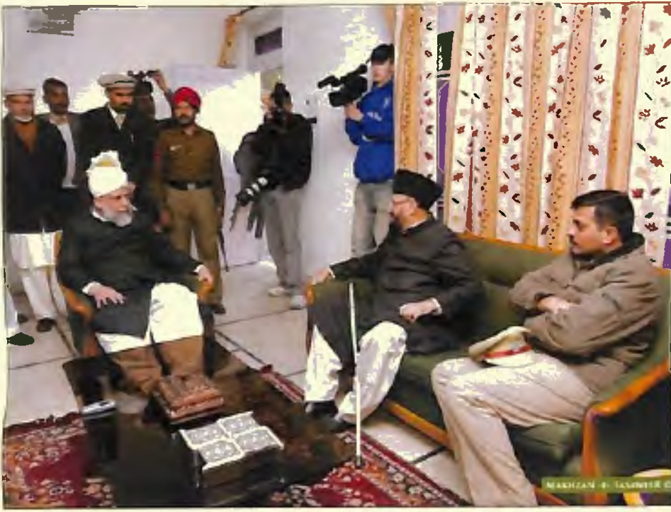
بنالہ میں حضور انور کا استقبال (15 دسمبر 2005)