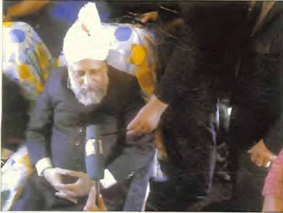
اٹلیائی وی کے نمائندگان حضور ایدہ اللہ تعالیٰ بنصرہ العزیز سے بات کرتے ہوئے