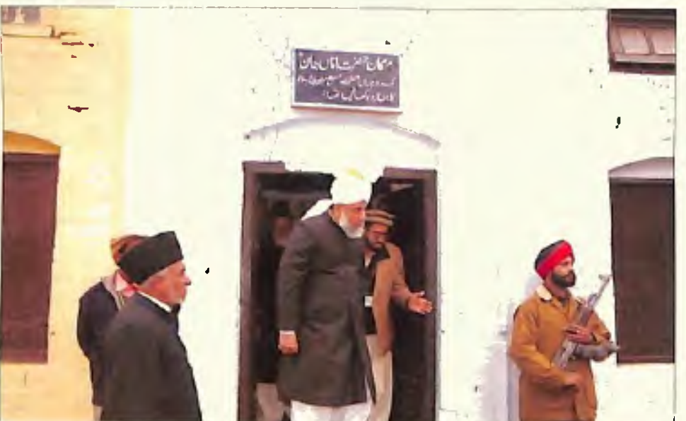
بہشتی مقبرہ قادیان میں وہ کہہ جہاں حضرت مسیح موعود علیہ السلام کی نیش مبارک رکھی گئی تھی (یکم جنوری 2006)