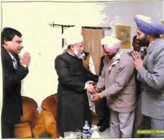
فیروز پورا اور امرتسر کے ریڈیو کے حکام حضور انور سے ملاقات کرتے ہوئے