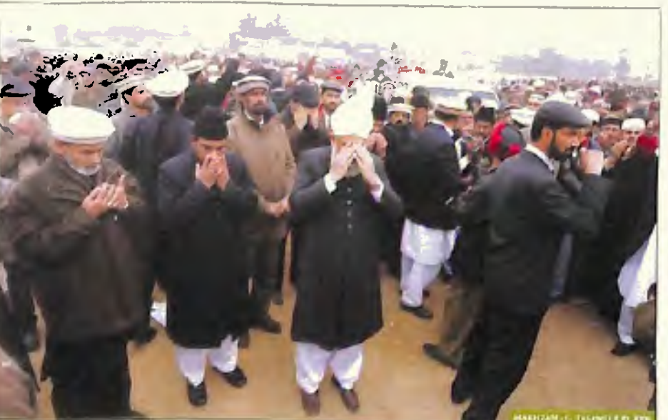
رواگی سے قبل حضور ایدہ اللہ تعالیٰ بنصرہ العزیز دعا کرتے ہوئے