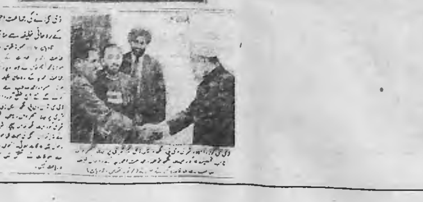
अहमदिया समुदाय के सम्मेलन को पूरा सहयोग देंगे...