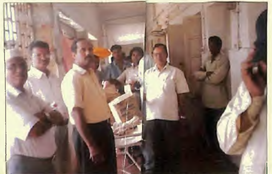
بھونیشور وادیہ میں مجلس انصار اللہ بھونیشور نے کرم سید فضل بی بی سلسلہ اور کرم رحمت اللہ صاحب زعم انصار اللہ بھونیشور کی زیر قیادت ہسپتال میں سٹاک اور فروٹ تقسیم کئے