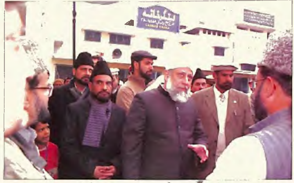
حضرت امیر المؤمنین انور خانہ حضرت مسیح موعود علیہ الصلوٰۃ والسلام میں (یکم جنوری 2006)