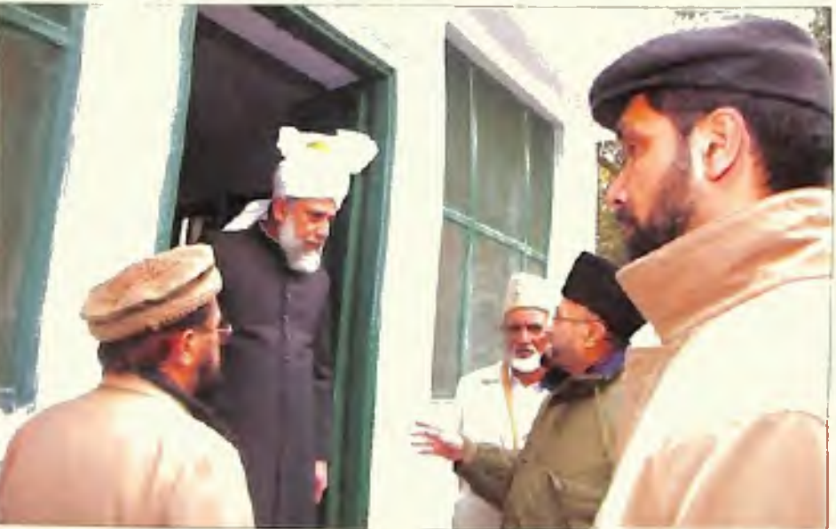
شیشین (بہشتی مقبرہ) میں حضرت امیر المؤمنین ایہ اللہ تعالیٰ بنصرہ العزیز (یکم جنوری 2006)