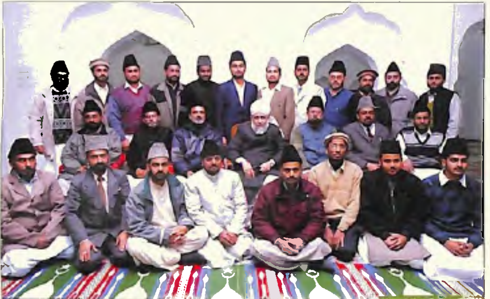
اساتذہ جامعہ احمدیہ قادیان (12 جنوری 2006)