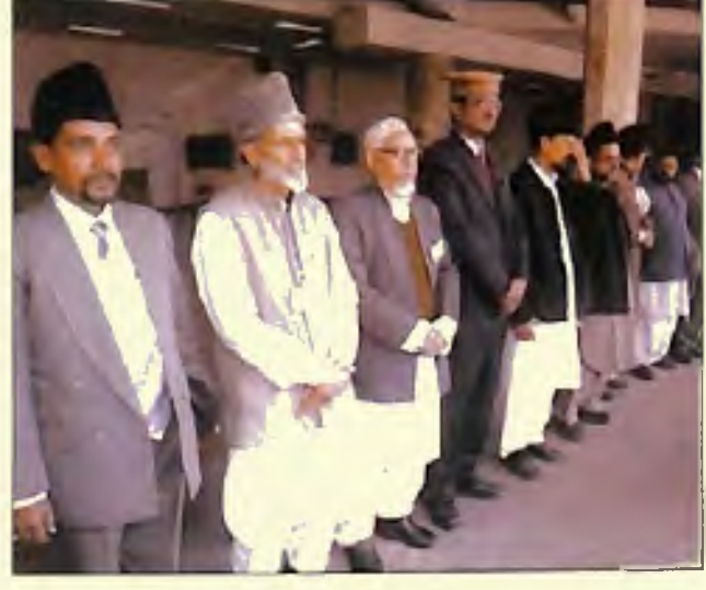
دہلی ایئر پورٹ پر مرکزی قائدگان حضور ایدہ اللہ تعالیٰ بنصرہ العزیز کی آمد کے انتقال میں (11 دسمبر 2005)