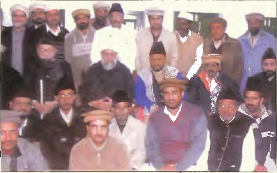
ممبران لوکل انجمن احمدیہ قادیان (14 جنوری 2006)