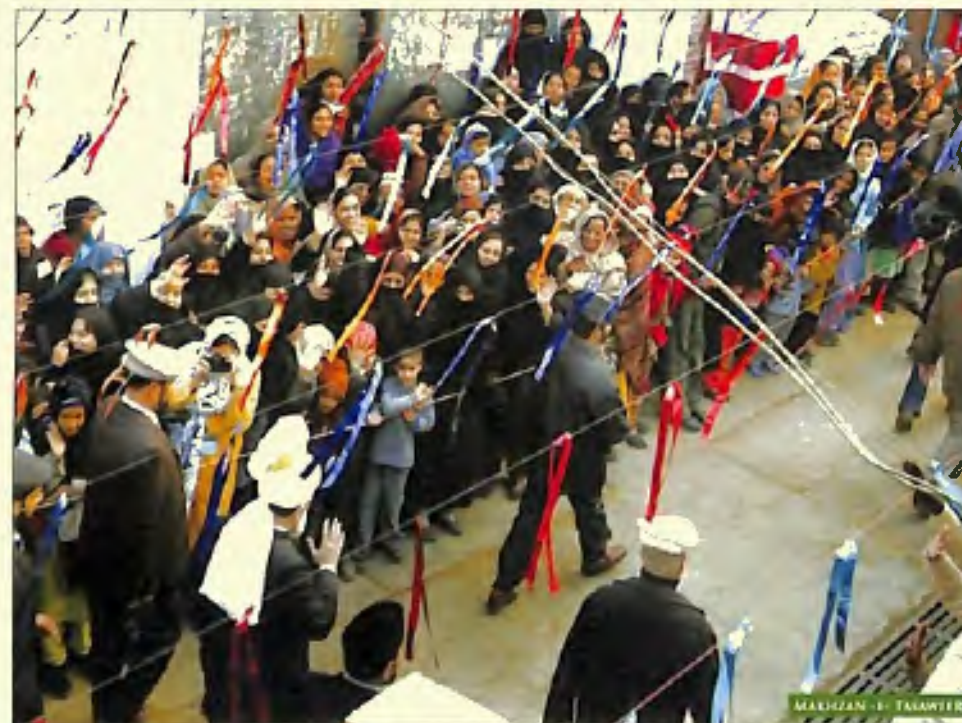
مستورات نے تعلیم الاسلام ہائی سکول میں حضور ایدہ اللہ تعالیٰ بنصرہ العزیز کا استقبال کیا (15 دسمبر 2005)