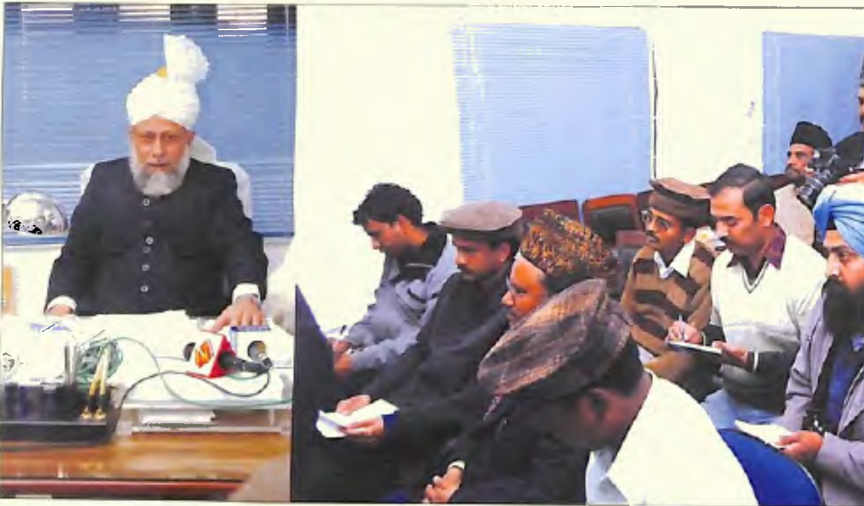
قادیان میں پریس کانفرنس (14 جنوری 2006)