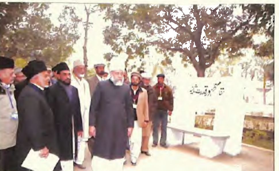
حضرت امیر المؤمنین ایہ اللہ تعالیٰ بنصرہ العزیز مقام ظہور قدرت ثانیہ میں (یکم جنوری 2006)