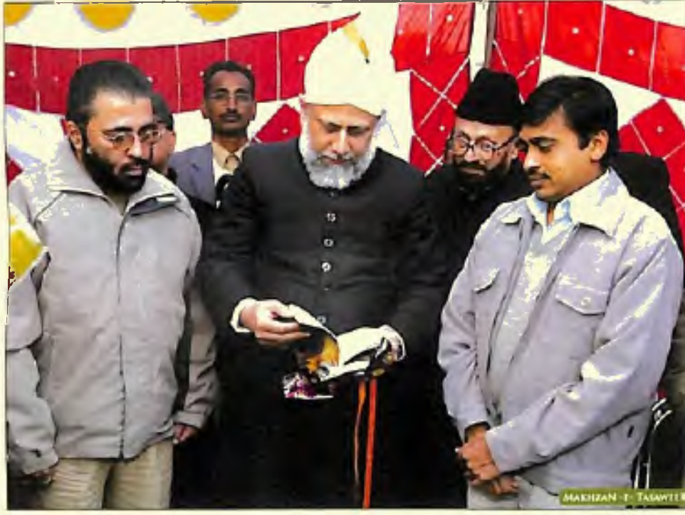
حضور ایدہ اللہ تعالیٰ بنصرہ العزیز S.S.P. بنالہ کی کتاب "نشوں سے ڈور نیا نویرا" کا اجرا فرماتے ہوئے (15 دسمبر 2005)