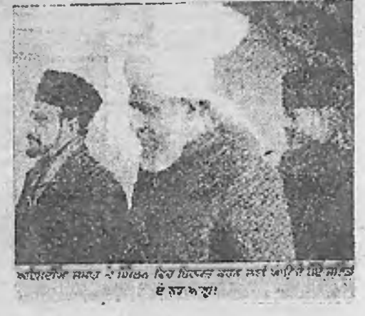
समाज अहिंसा का 114वां अंतरराष्ट्रीय सम्मेलन शुरू...