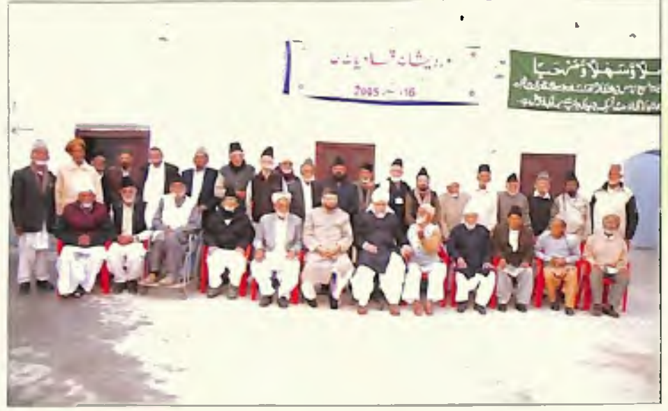
درویشان قادیان اپنے آقا کے ہمراہ (16 دسمبر 2005)