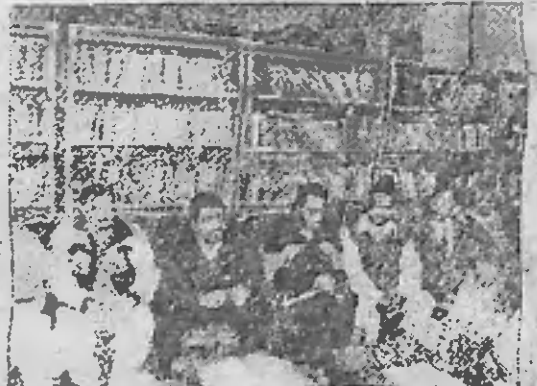
डीसी ने सालाना जलसे पर प्रबंध के लिए दिए आवश्यक निर्देश...