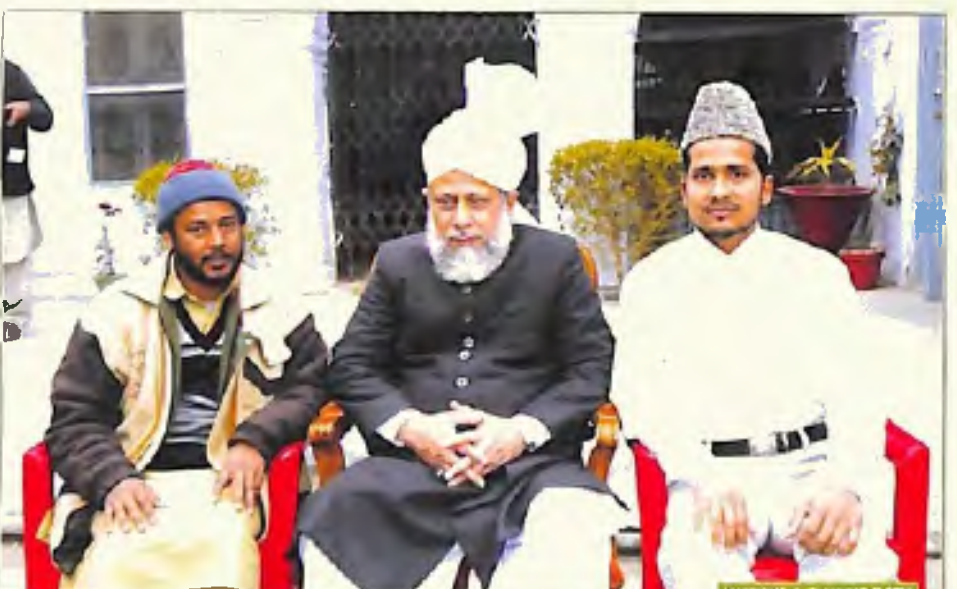
نائب مدیران ہفت روزہ بدر قادیان (15 جنوری 2006)