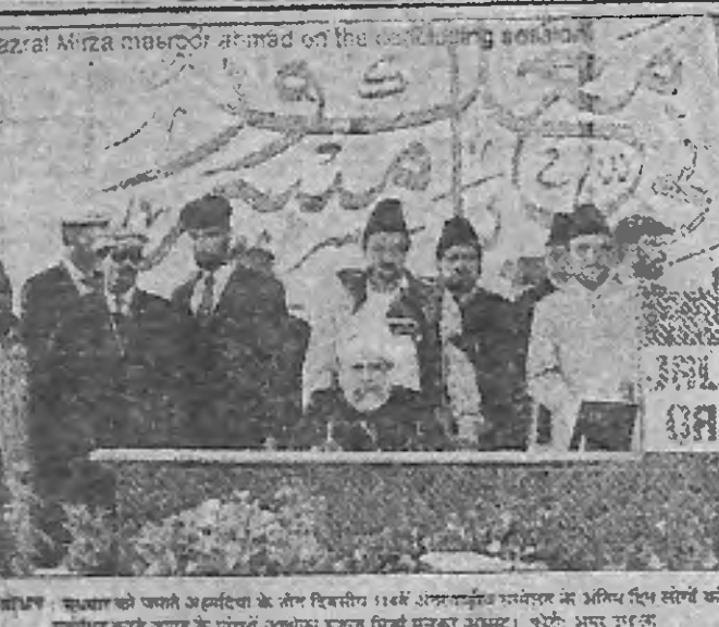
Amiriyya Council members standing together.