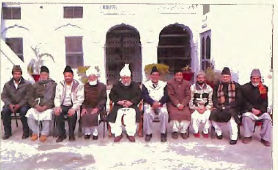
ممبران تحریک جدید انجمن احمدیہ قادیان (9 جنوری 2006)