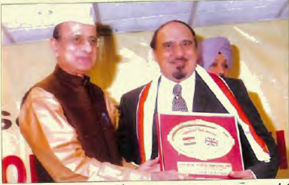
ڈاکٹر افتخار احمد صاحب ایاز NRI کے سالانہ اجلاس منعقدہ لندن میں عالی جناب محترم ناران سنگھ سابق گورنر تامل ناڈو سے 'ایسٹ این آر آئی' ایوارڈ لینے ہوئے۔ (5 مارچ 2006)