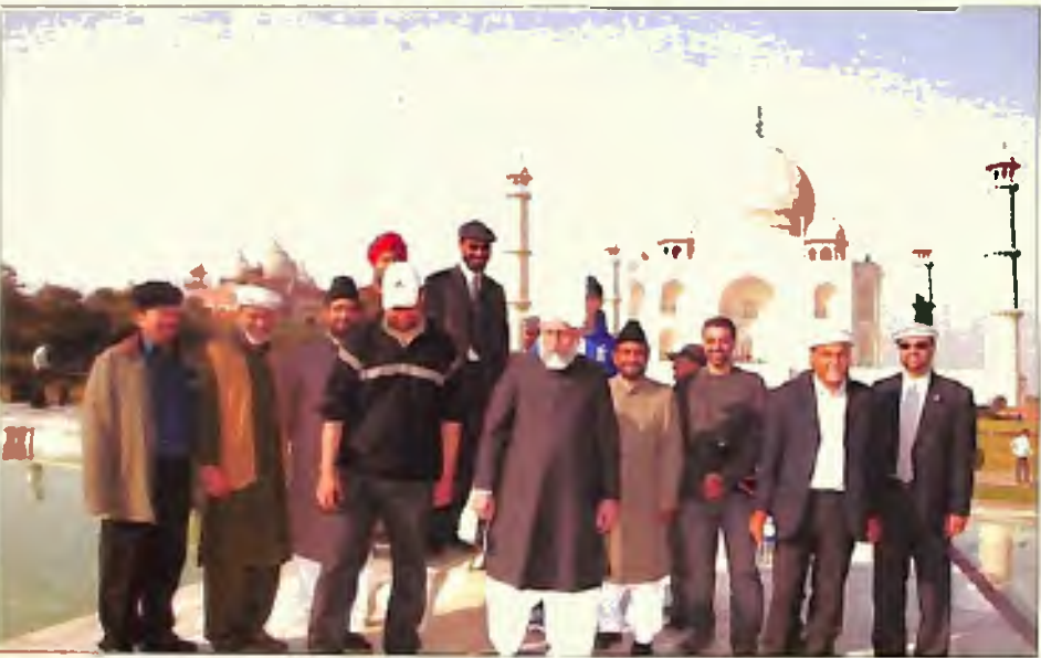
آگرہ میں حضور انور مسیح موعود علیہ السلام کے سامنے (13 دسمبر 2005)