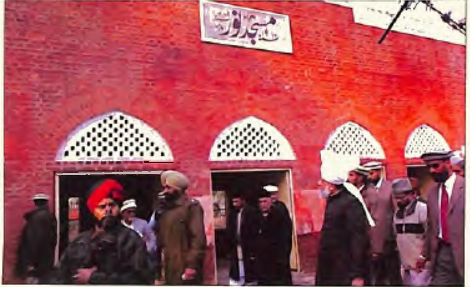
حضور ایدہ اللہ تعالیٰ بنصرہ العزیز سجد نور قادیان میں۔ یہ وہ تاریخی مسجد ہے جہاں خلافتِ نبویہ کا انتخاب عمل میں آیا تھا (2 جنوری 2006)