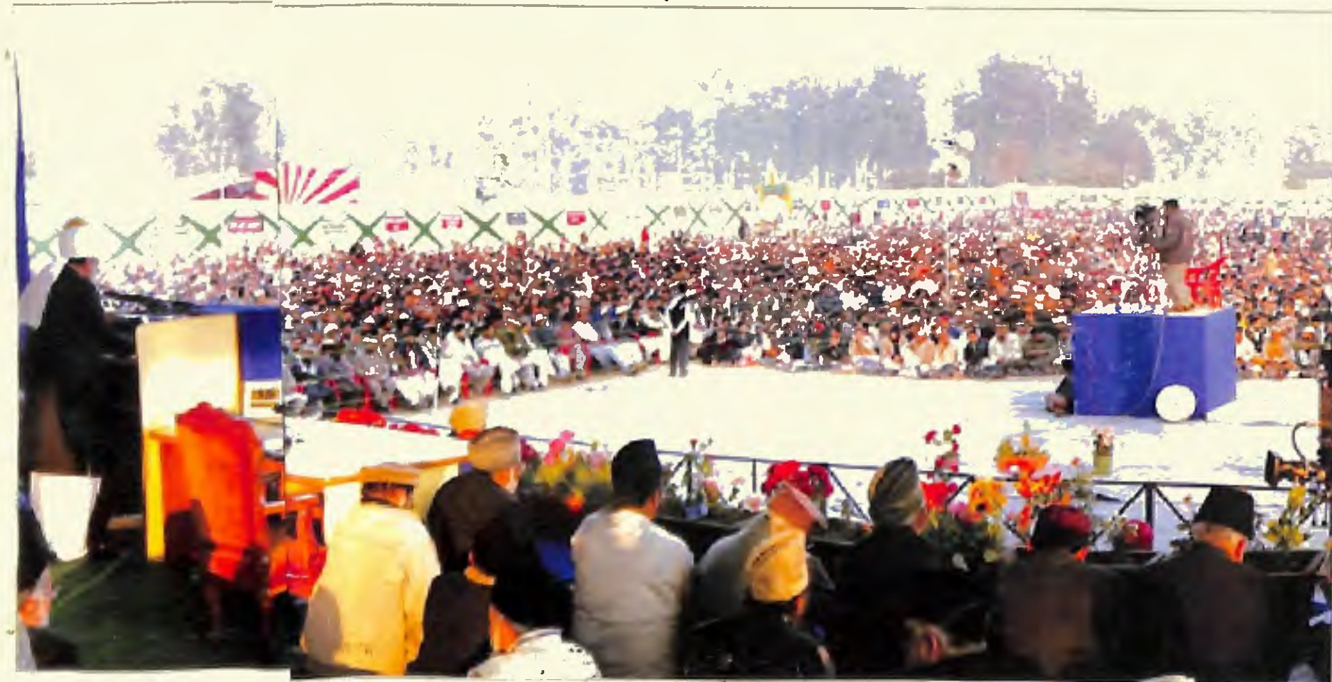
جلسہ گاہ میں بیٹھے ہوئے سامعین کا ایک اور منظر