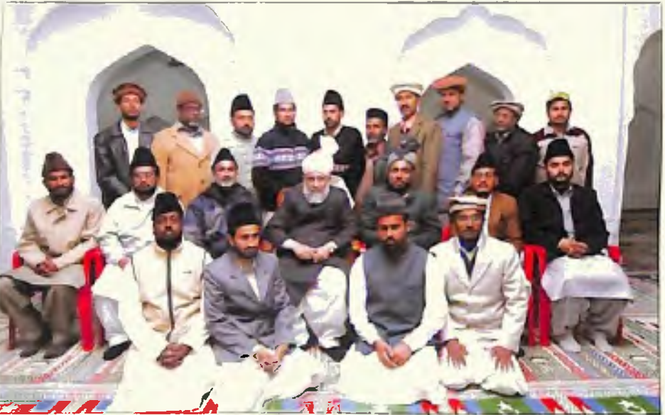
اساتذہ جامعہ اشرفین قادیان (12 جنوری 2006)