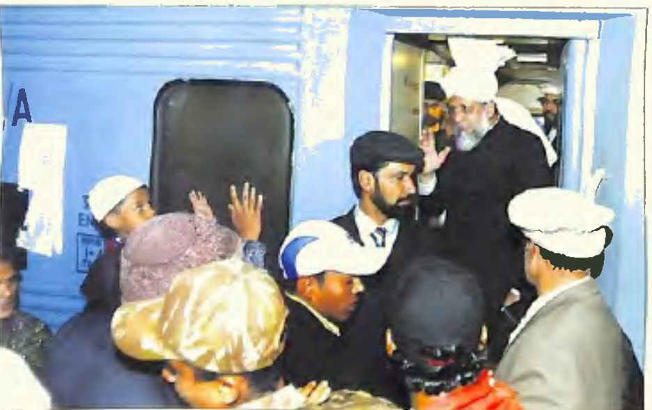
رواگی سے قبل حضور ایدہ اللہ تعالیٰ بنصرہ العزیز احباب قادیان کے الوداع کا جواب دیتے ہوئے