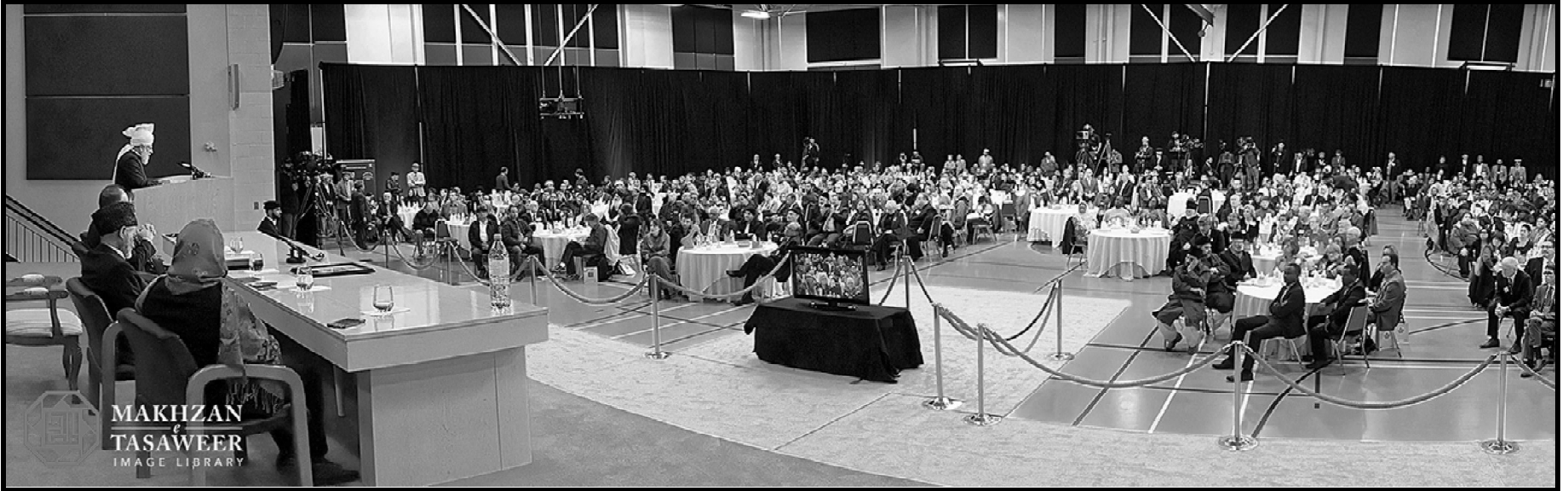
MAKHZAN TASAWER IMAGE LIBRARY

صحابہ نے جنگوں میں حصہ لیا تو اس کا مقصد لوگوں کی عبادت کے حق کا دفاع کرنا تھا تاکہ وہ جیسے چاہیں عبادت کریں۔ حضور انور ایدہ اللہ تعالیٰ بنصرہ العزیز نے فرمایا: آج ہم ایسے دور سے گزر رہے ہیں جہاں اسلام پر اکثر یہ الزام لگایا جاتا ہے کہ اسلام دوسروں کے حقوق تلف کرتا ہے جبکہ حقیقت مکمل طور پر اس کے برعکس ہے۔ اسلام وہ مذہب ہے جس کی تعلیمات نے تمام لوگوں اور تمام مذاہب کے حقوق کی حفاظت کا بیڑا اٹھایا ہے۔ اسلام یہودیوں اور