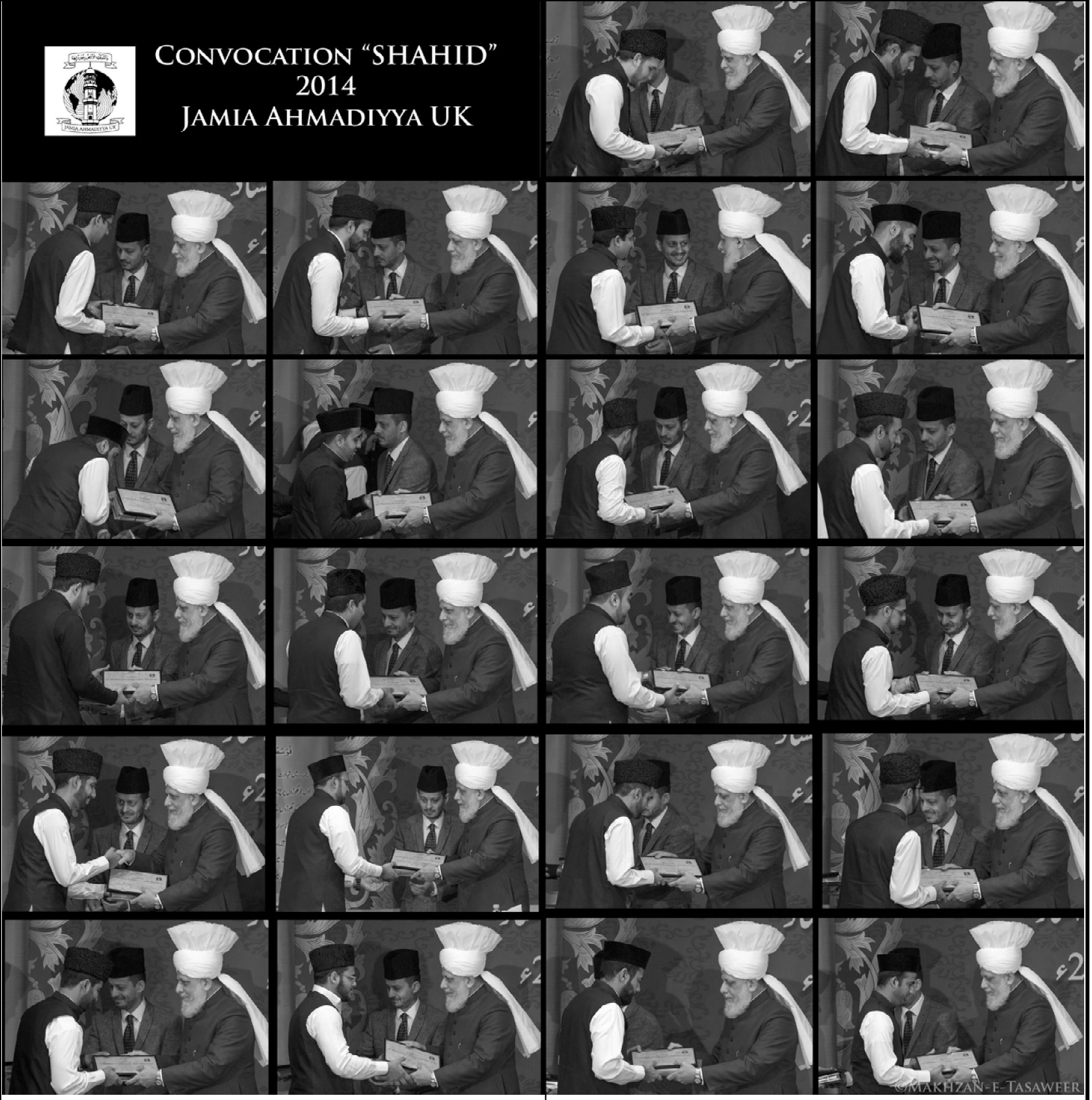
شاہدین جامعہ احمدیہ یو کے (UK) 2014ء حضرت خلیفۃ المسیح الخامس ایدہ اللہ تعالیٰ بنصرہ العزیز سے ڈگری وصول کرتے ہوئے