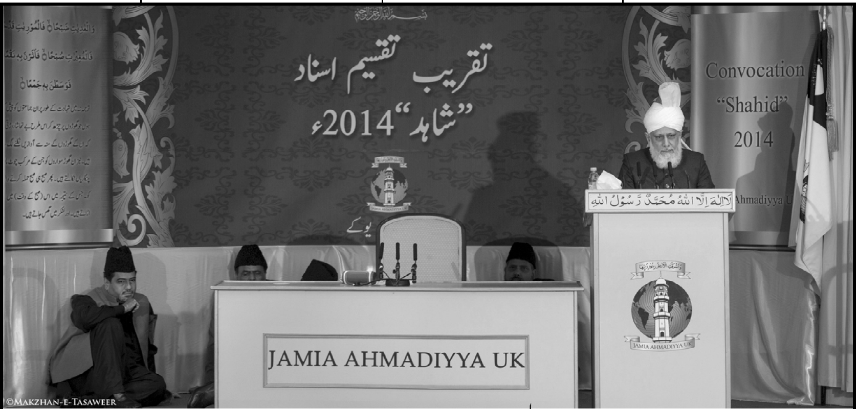
حضرت امیر المؤمنین خلیفۃ المسیح الخامس ایدہ اللہ تعالیٰ بنصرہ العزیز کانووکیشن سے خطاب فرماتے ہوئے

حضرت امیر المؤمنین خلیفۃ المسیح الخامس ایدہ اللہ تعالیٰ بنصرہ العزیز نے مورخہ 13 دسمبر 2014ء ہفتہ کے دن جامعہ احمدیہ یو کے (UK) کے تیسرے کانووکیشن میں شرکت فرمائی۔ بلاشبہ یہ دن انگلستان کی کاؤنٹی سرے کے ایک خوبصورت قصبہ ہیزل میمر (Haslemere) میں واقع جامعہ احمدیہ یو کے کی تاریخ میں سنہری حروف سے