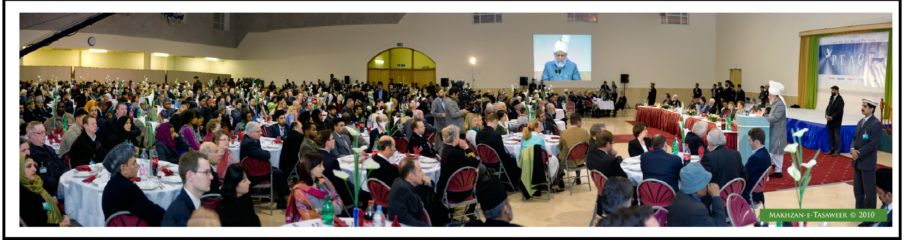
MAKHZAN-E-TASAWER © 2010

تھا کہ قریب کھڑا نوجوان اس کی طرف اشارہ کر کے آواز لگا رہا ہے ”برقعے کی اجازت نہیں“۔ یہ مسئلہ ایک دوسرے پر طنز اور چرکے لگانے کی بنیاد ہے۔ سنجیدہ مزاج عاقل شخصیات جن کے ہاتھ میں نظام اور قانون سازی ہے انہیں اس قسم کی ذاتی چیزوں میں بے جا مداخلت نہیں کرنی چاہئے۔ اگر یہ معاملات طول اختیار کر جائیں تو کیا عیسائی اور یہودی مذہب کی خواہشیں جو اپنی مذہبی تعلیمات کے مطابق لباس پہننا چاہتی ہوں ان کے خلاف بھی قانون سازی کرنی ہوگی؟ اگر مسلمانوں پر اس قسم کی پابندیاں لگائی جائیں تو مسلمان حکومتیں بھی مغربی لباس پر پابندیاں لگانے کی